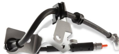
Flexíveis de freio sobremoldados