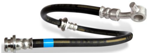
Flexíveis de freio